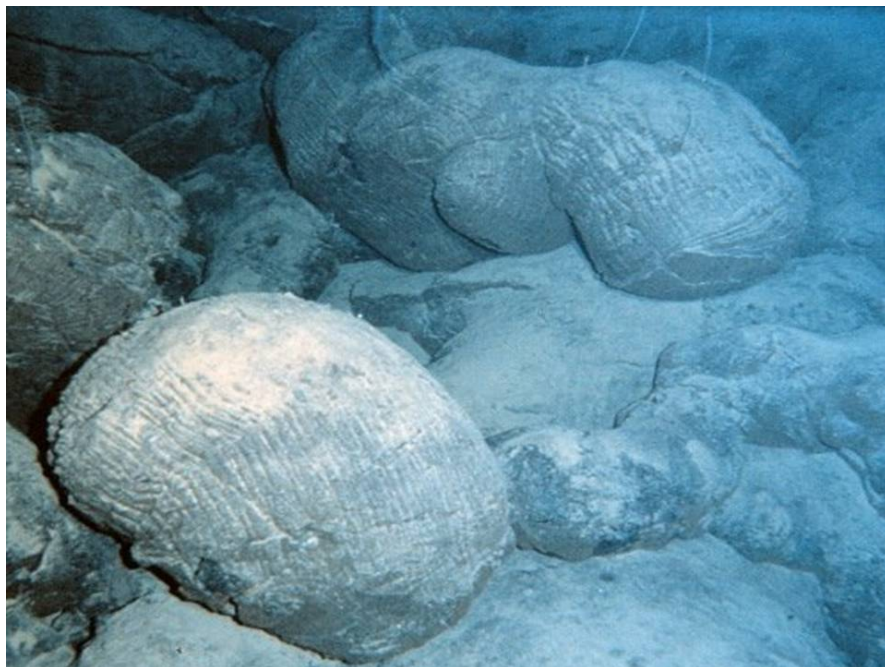
Рис. 2. Подушечные базальты (пиллоу-лавы), излившиеся в рифтовой долине Срединно-Атлантического хребта.